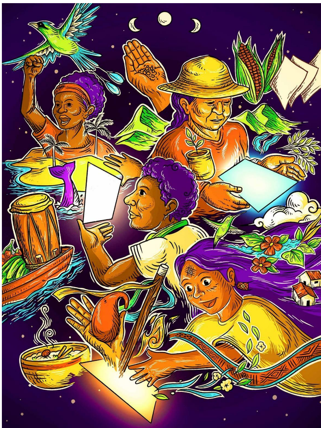
Tic, un universo de posibilidades – Ana Velasco Ganadora del concurso carteles en primer lugar Colombia, IPDRS 2024