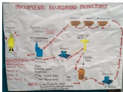
Figura 6 Procedimientos de bioseguridad para productores

La cuarentena decretada durante el 2020 debido al COVID-19 afectó de manera significativa a Flor de Leche, en primer lugar, debido a su gran dependencia del subsidio de maternidad y lactancia como principal mercado. Debido al COVID-19 se frenó temporalmente la provisión del subsidio y por lo tanto Flor de Leche tuvo que reducir significativamente su producción, lo cual afectó tanto a la empresa como a sus proveedores pues tuvo que dejar de comprar leche al no tener donde acomodar sus productos.