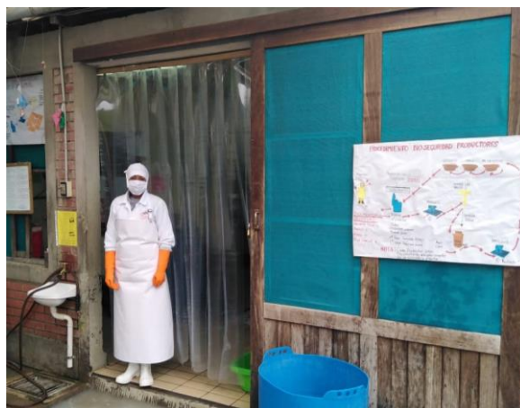
Figura 7 Área de recepción de materia prima

Sin embargo, pese a todo lo negativo que trajo la pandemia COVID-19 Flor de Leche puede aún rescatar algunos aprendizajes positivos como ser lo importante del trabajo en equipo y la necesidad de articularse en redes con otras empresas para afrontar crisis como estas: