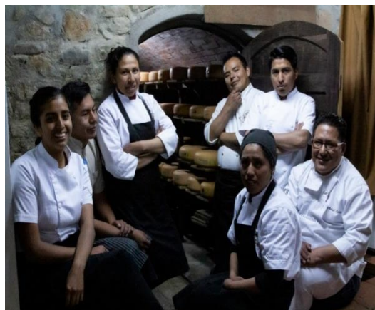
Figura 5 Personal que trabaja en el restaurante de Flor de Leche en Achocalla