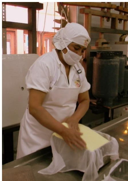
Figura 3 Producción de queso

transformar con tres a cuatro personas y maquinaria industrializada. Sin embargo, siguiendo su filosofía de empresa eco-social, Flor de Leche apuesta por la producción artesanal y la generación de empleos que eso conlleva. Es así que en la planta de producción trabajan alrededor de 25 personas y otras 10 personas en el área administrativa y de comercialización. Además de la producción de quesos, Flor de Leche, también cuenta con un restaurant en Achocalla, donde se emplean aproximadamente 15 personas, de las cuales 10 personas atienden el restaurant los fines de semana y otras personas apoyan en el sistema y temas contables externos. En total 35 personas son personal fijo, y el resto es contratado por servicio cuando es necesario.