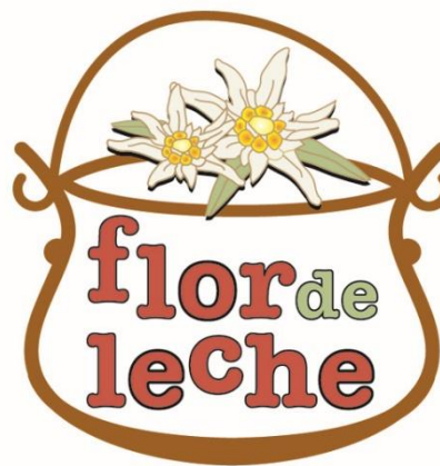
Figura 2 Logo de Flor de Leche

Ser una empresa eco-social significa para Flor de Leche ir mucho más allá de obtener beneficios económicos sino también buscar un equilibrio y armonía con el medio ambiente y sustentar proyectos sociales en beneficio de los demás, los cuales incluyen actividades educativas, culturales y la promoción del desarrollo local.