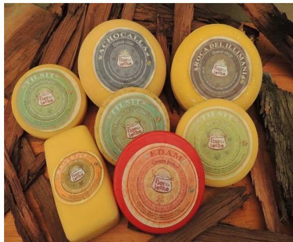
Figura 1 Variedad de quesos producidos de forma artesanal

Flor de Leche es una organización eco-social productiva que nace en 1998, en el municipio de Achocalla que se encuentra entre La Paz y El Alto. Inicio al principio con muy poca producción de leche, actualmente compra la leche de más de 150 familias y emplea a más de 36 personas para elaborar quesos y yogures frescos y añejos. Flor de Leche nace bajo la iniciativa de Stanislas Guilles, quien había trabajado alrededor de 11 años en educación de adultos, junto con la cooperación internacional en el Norte de La Paz, en la provincia Bautista Saavedra; de esta experiencia en el campo, le nace la necesidad de construir un proyecto que pueda sostenerse económicamente de forma autónoma sin depender de financiamiento externo.