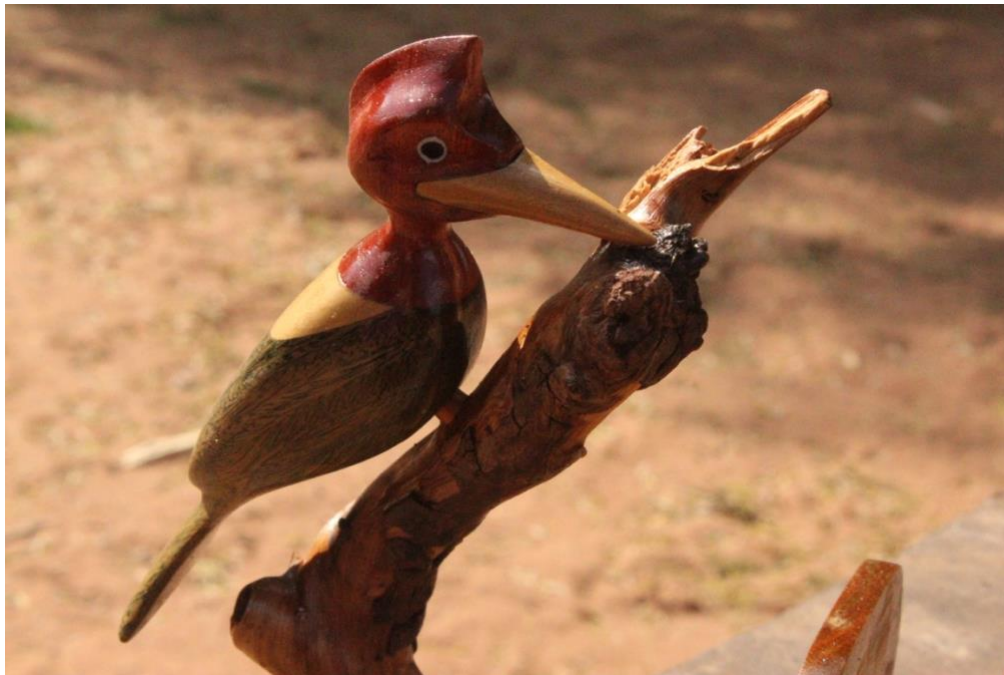
Foto 8. Un pájaro carpintero tallado en Chimeo.

En el próximo futuro, queremos obtener señal de internet para la comunidad y así desarrollar publicidad, contenidos sociales, contactos con turistas. Crear y mejorar la gestión de atención al cliente, haciendo que las artesanas y artesanos utilicen medios tecnológicos, tanto para la venta como para acercar a más personas. Y finalmente, llevar a la asociación a un punto en el que pueda iniciar una microempresa de tejido artesanal, haciendo innovación.