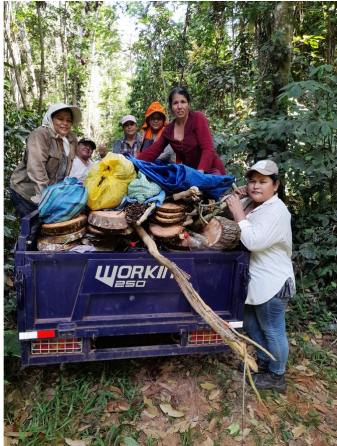
Foto 17. Recolección de material de artesanías amazónicas.

La naturaleza es todo para nosotras, realmente nosotras sacamos todo de ella. Con lo que nos da, con los cocos de la almendra, con las semillas, nosotras tenemos salud (nuestros bosques contienen muchas plantas medicinales para sanar nuestras enfermedades), educación, vestimenta, tenemos esta independencia económica. Es por eso que nosotros cuidamos mucho a esta naturaleza, porque tenemos todo ahí, así que nuestro territorio es importante para nosotras.