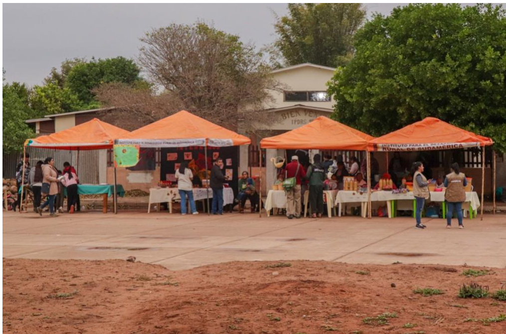
Foto 15. El Encuentro desde una vista externa.

Hoy, en el mercado se adoptó la combinación del hilo de algodón con el hilo sintético, para que el cliente se sienta en una hamaca que sea fresca. Por eso, es que es la combinación, cuando el cliente te dice: "yo quiero un solo color". Le explicamos, le mostramos los hilos.