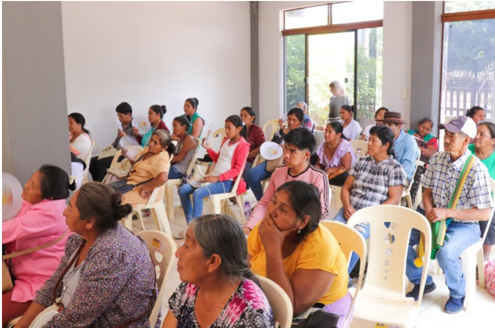
Foto 4. Artesanas y artesanos que participaron del Encuentro. Tomada por Gonzalo Baptista (2024).

Artes donde se puedan formar a más mujeres y que trabajen ya desde sus lugares.