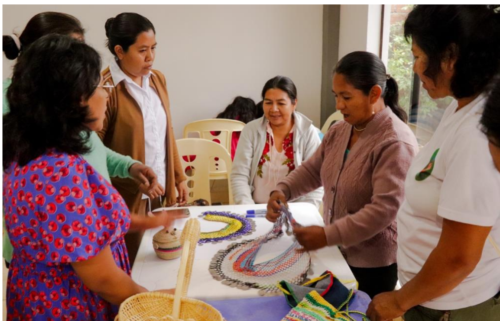
Foto 12. Artesanas weenhayeks y guaraníes en una mesa sobre narrativas de productos en el Encuentro de artesanas.

Muchas veces nos falta conocer las normativas que nos amparan para poder exigir nuestros derechos y necesidades, es la mejor forma de interpelar a las autoridades. Ahora, también estamos generando normativa municipal para proteger nuestras actividades. Es importante conocer las normativas que amparan al sector.