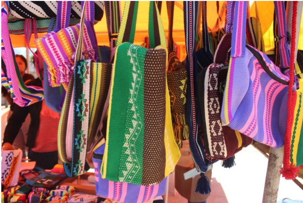
Foto 3. Feria de Machareti 2022, productos de las tejedoras de Santa Rosa.

Y nosotras, como nueva generación, estamos combinando diferentes colores, tenemos el amarillo, el naranja, ya estamos un poco modernizado los colores para poder vender productos y atraer clientes. Entonces usamos los colores ancestrales del pueblo guaraní y también lo que nos pida nuestros/as clientes.