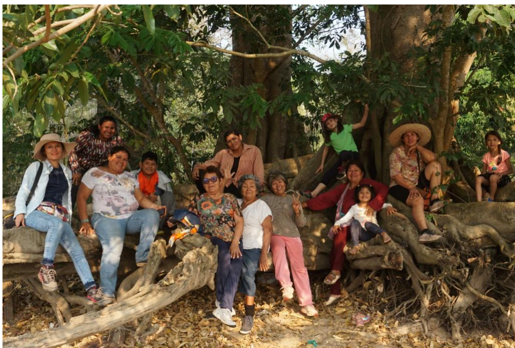
Foto 19. Las Semillas de Oro en una recolección de material.

Tenemos que trabajar antes de ver el futuro, para posesionarnos a nivel nacional y poder sacar afuera nuestras artesanías. Hay que ir paso por paso, de lo local, departamental y hasta la nacional e internacional. Y yo pienso que a nosotras las artesanas nos cuesta porque no hemos mantenido al margen de la situación política partidaria. A nosotras no nos gusta eso, cada quien -hemos dicho-, tiene su propio partido político, tiene su propia visión, pero en la artesanía queremos dejar eso atrás y trabajar como artesanas. No tenemos que mezclar esos temas y lograr salir delante de manera autónoma.